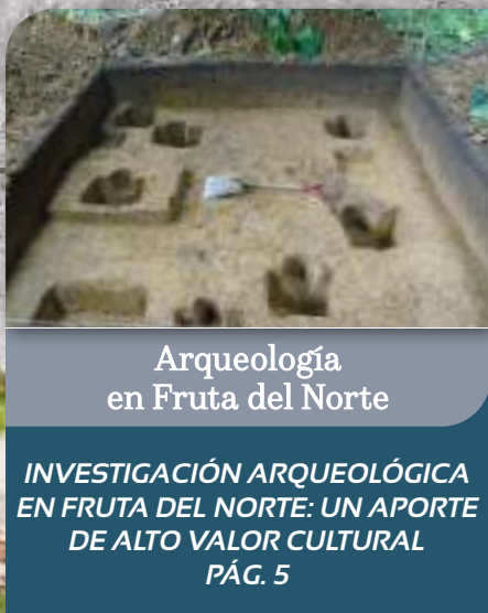
Arqueología en Fruta del Norte

INVESTIGACIÓN ARQUEOLÓGICA EN FRUTA DEL NORTE: UN APORTE DE ALTO VALOR CULTURAL PÁG. 5