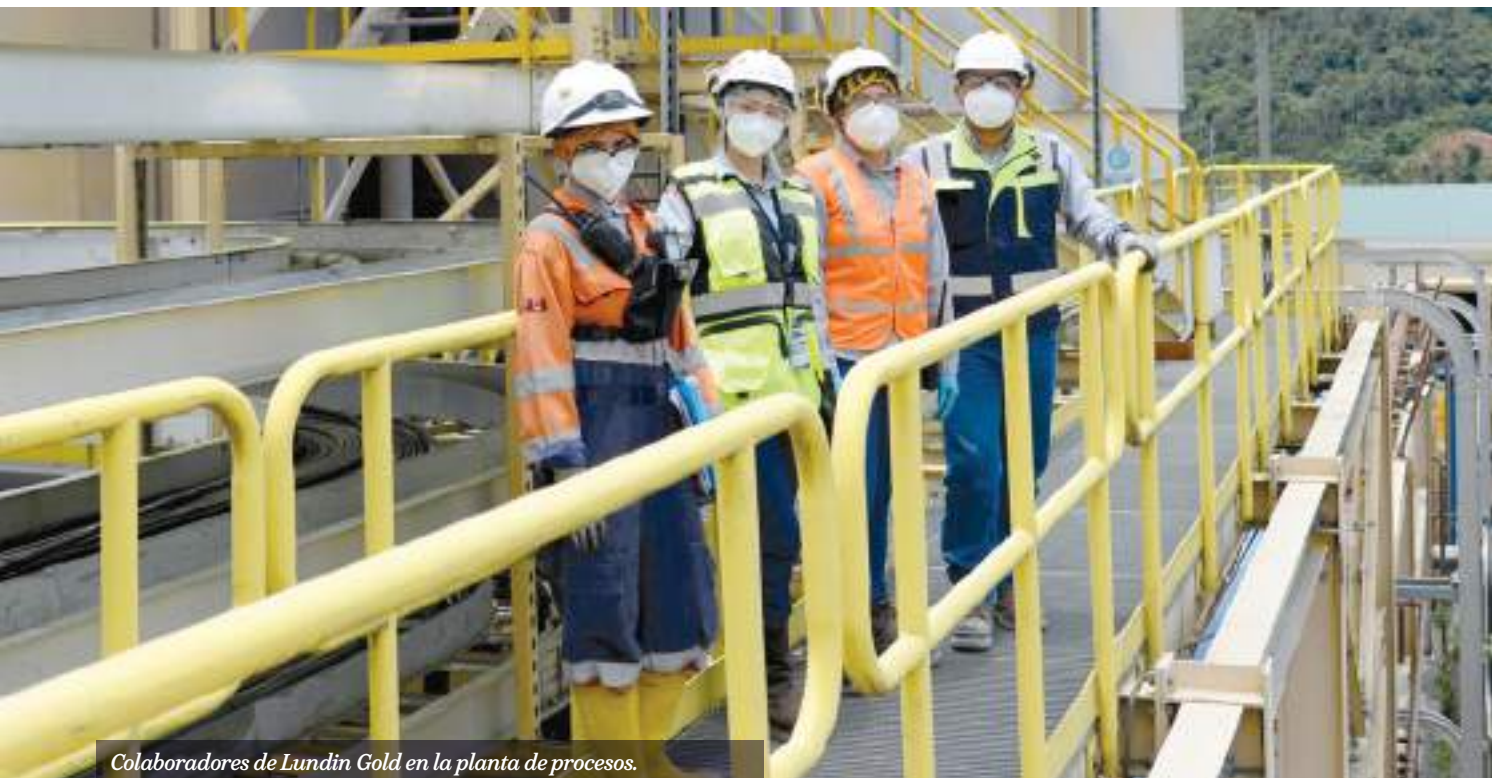
Colaboradores de Lundin Gold en la planta de procesos.