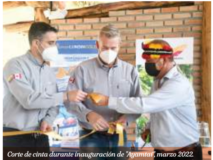
Corte de cinta durante inauguración de "Ayamtai", marzo 2022.

A su vez, permite la capacitación y formación de los miembros de la nacionalidad Shuar y de la población que esté interesada en aprender y compartir sus conocimientos gastronómicos, en un espacio de interculturalidad.