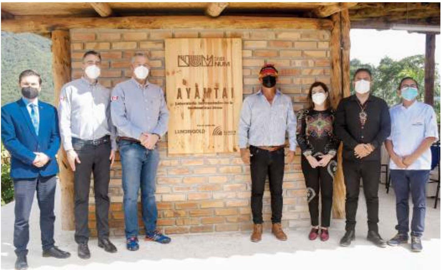
Develación de placa durante la inauguración de "Ayamtai", marzo 2022.