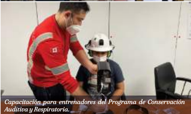
Capacitación para entrenadores del Programa de Conservación Auditiva y Respiratoria.