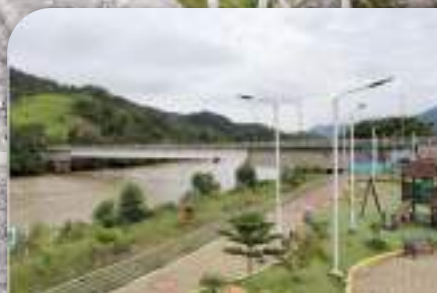
Fortalecimiento Económico y Social

INVESTIGACIÓN ARQUEOLÓGICA EN FRUTA DEL NORTE: UN APORTE DE ALTO VALOR CULTURAL PÁG. 5