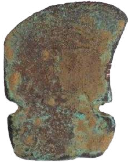
Hacha de piedra probablemente usada en actividades agrícolas

El patrimonio arqueológico es importante, y su preservación y gestión es responsabilidad de todos los ciudadanos, al ser parte de nuestra historia y un legado de nuestros ancestros. En este contexto y durante los últimos 10 años, Lundin Gold, junto con especialistas en arqueología y ramas afines, desarrollaron el Programa de Investigación Arqueológica . Estos estudios se desarrollaron con autorización y control técnico del Instituto Nacional de Patrimonio Cultural Zona 7.