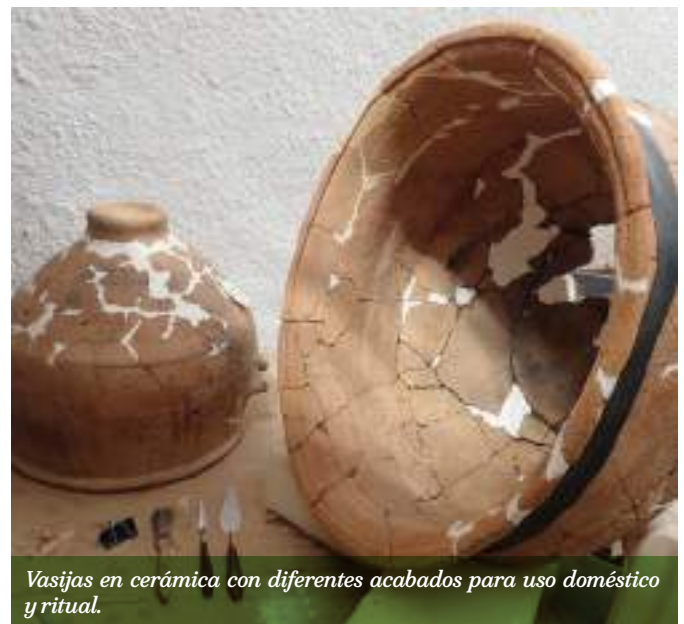
Vasijas en cerámica con diferentes acabados para uso doméstico y ritual.

Mediante pruebas de Carbono 14, un método utilizado para determinar la edad de materiales y objetos se concluyó que en la franja de estudio se desarrollaron las sociedades prehispanicas cuya temporalidad abarca los grandes periodos de la arqueología ecuatoriana: Precerámico o Paleoindio, Formativo, Desarrollo Regional y, Tardío o Integración . Las comunidades experimentaron, conocieron y aprovecharon los recursos del entorno, y a través del tiempo llegaron a construir una sociedad que en el marco de estas investigaciones se ha denominado “Cultura Machinaza” .