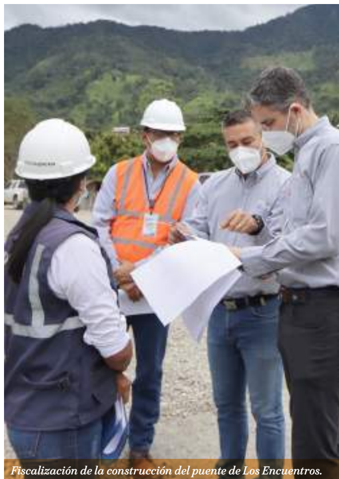
Fiscalización de la construcción del puente de Los Encuentros.

Continuaremos en la misma línea de 2021. Es decir, alineados al diálogo generado en las Mesas de Trabajo del GAD parroquial Los Encuentros. Continuaremos apoyando en los siguientes ejes: Apoyo al sector educativo, promoción de la salud, mejoramiento de la infraestructura local, impulso de la cultura y el deporte, apoyo al sector agropecuario y fomento al emprendimiento local.