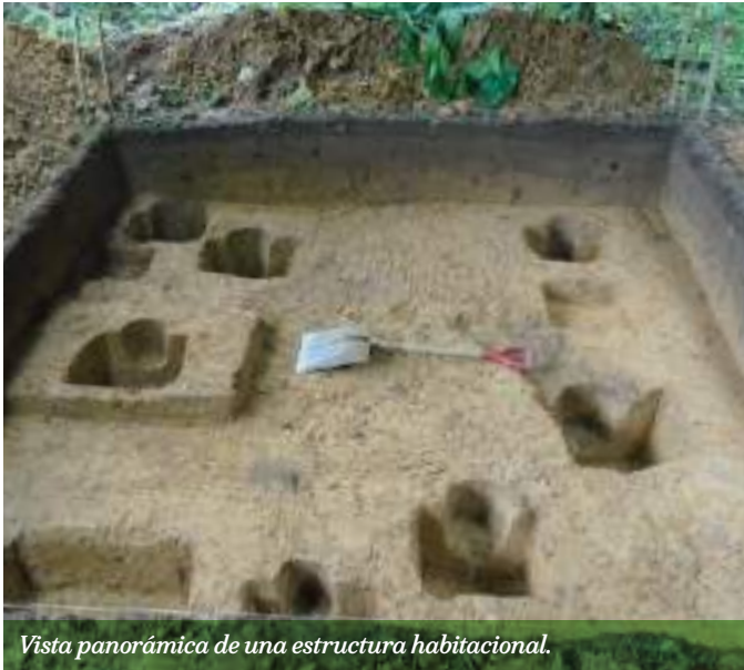
Vista panorámica de una estructura habitacional.