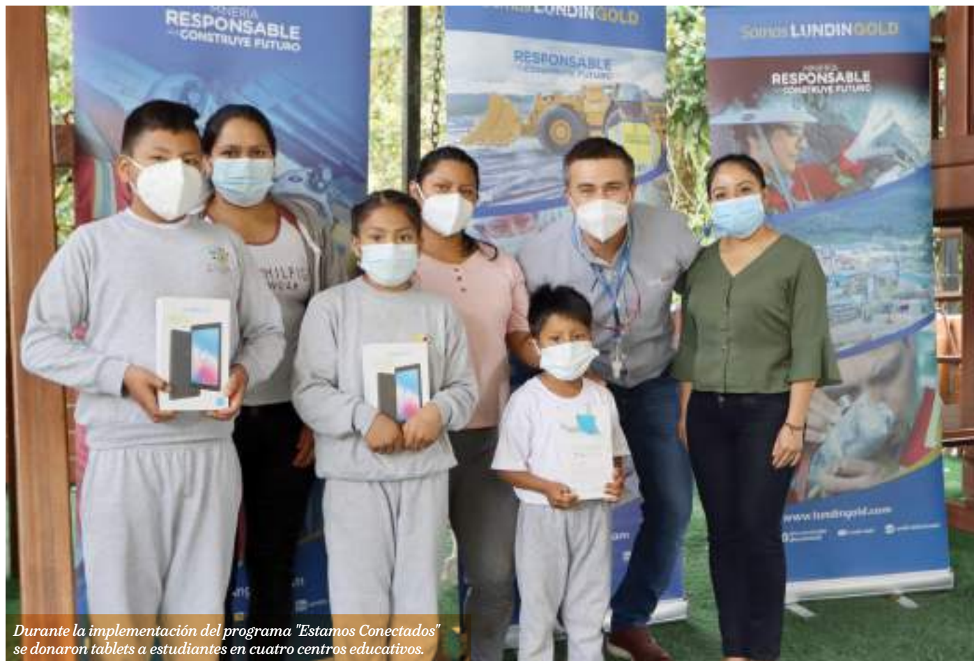
Durante la implementación del programa "Estamos Conectados" se donaron tablets a estudiantes en cuatro centros educativos.