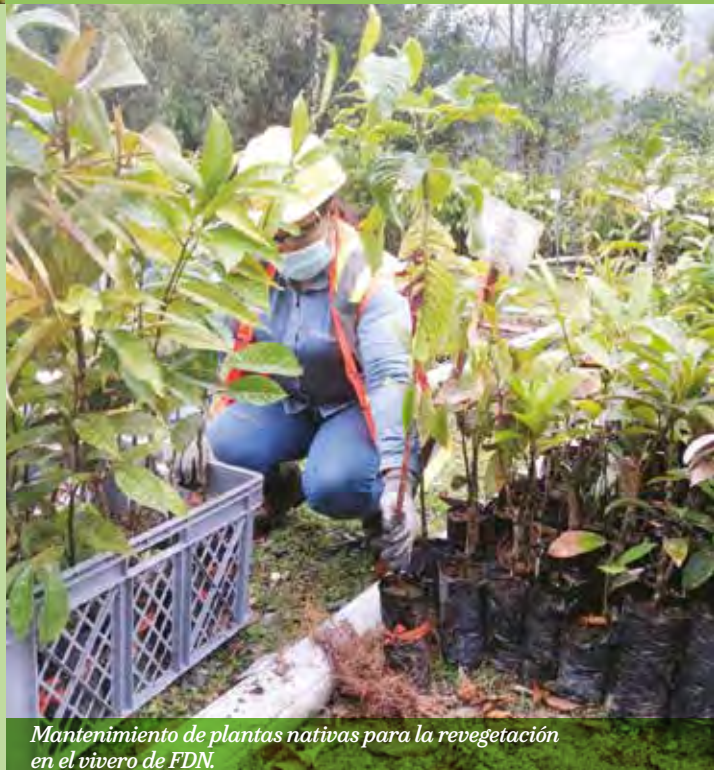
Mantenimiento de plantas nativas para la revegetación en el vivero de FDN.

La Compañía ejecuta este plan siguiendo la jerarquía de mitigación: evitar, minimizar, restaurar y compensar. Una de las medidas aplicadas dentro de la categoría “evitar” fue la optimización del diseño y reducción del área de desbroce planificada inicialmente, en alrededor de un 28% en total. Como parte de la “minimización” se diseñaron y pusieron en marcha planes, procedimientos y manuales en varias áreas: rescate y reubicación de especies, gestión del agua, de los desechos y el control de erosión, entre otros. La Compañía también lleva a cabo un plan de “restauración” progresiva de áreas desde el final de la etapa constructiva, para acelerar la recuperación de las áreas intervenidas.