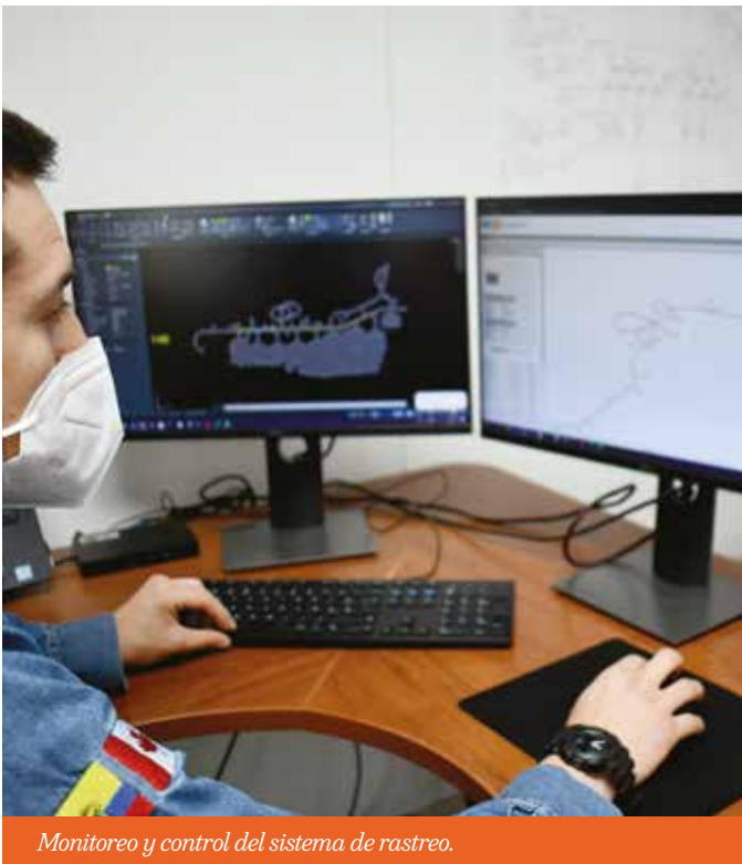
Monitoreo y control del sistema de rastreo.

S iguiendo la visión de hacer de Fruta del Norte una mina innovadora de última tecnología que aplica el principio fundamental de Trabajo con Seguridad y la optimización de las operaciones, Lundin Gold implementa un sistema de rastreo del personal y equipos, dentro y fuera de las instalaciones de la mina subterránea.