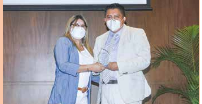
Reconocimiento del IESS por las buenas prácticas de Lundin Gold en el manejo del COVID-19.

Gracias a la vacunación, el periodo de cuarentena hotelera se ha reducido a 2 días, tiempo durante el cual se realiza una prueba PCR. Solo si el resultado es negativo, se autoriza el ingreso a campamento. Es importante notar que en Lundin Gold se mantiene el uso permanente de mascarilla, el lavado frecuente de manos e higiene personal, desinfección de espacios, distanciamiento físico, comunicación oportuna de síntomas, control de temperatura y exámenes periódicos para verificar el estado de salud de empleados y contratistas.