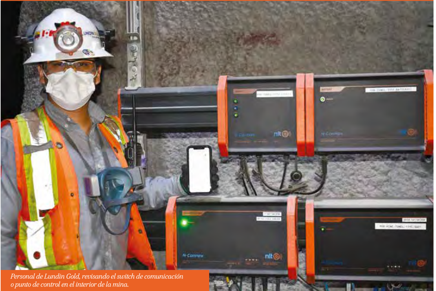
Personal de Lundin Gold, revisando el switch de comunicación o punto de control en el interior de la mina.