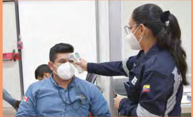
Toma de temperatura antes de pasar a la sala de vacunación.

Hasta el momento, todo el personal de Lundin Gold y contratistas cuentan con dos dosis de vacunación, y hemos iniciado la aplicación de la tercera dosis de refuerzo.