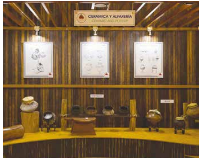
Exhibición de utensilios de la cultura Shuar.