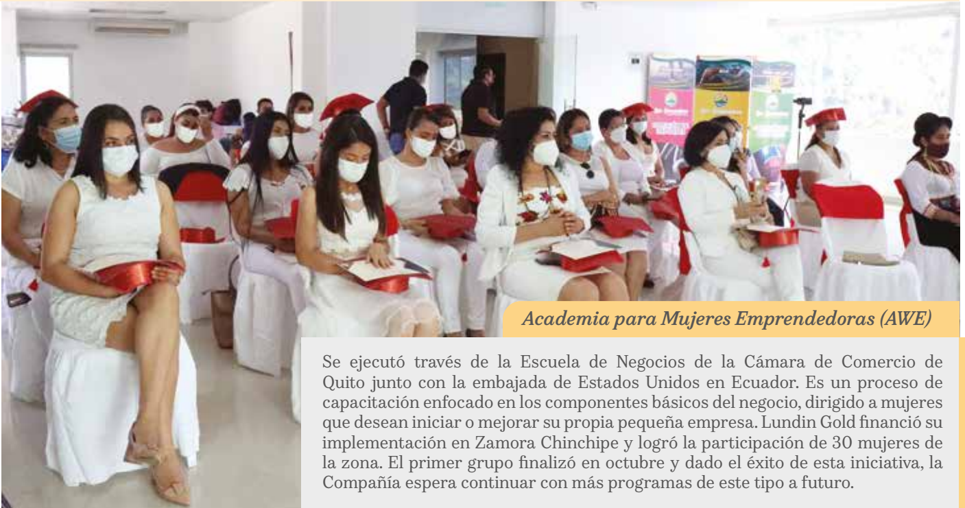
Academia para Mujeres Emprendedoras (AWE)

Como parte del compromiso de Lundin Gold con la promoción de la diversidad e inclusión en las iniciativas desarrolladas a través de su Estrategia de Sostenibilidad en la zona de influencia, la Compañía junto con Fundación Lundin, desarrolló dos programas.