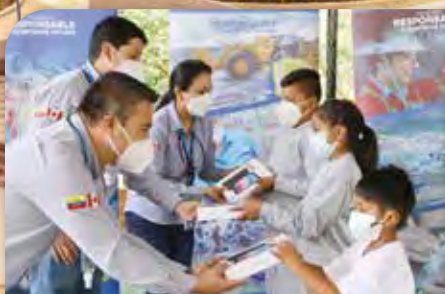
Fortalecimiento Económico y Social

LUNDIN GOLD CUMPLE ESTÁNDARES INTERNACIONALES PARA PROTEGER LA BIODIVERSIDAD / PÁG. 6