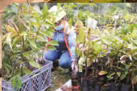
Gestión Ambiental en Fruta del Norte

LUNDIN GOLD CUMPLE ESTÁNDARES INTERNACIONALES PARA PROTEGER LA BIODIVERSIDAD / PÁG. 6