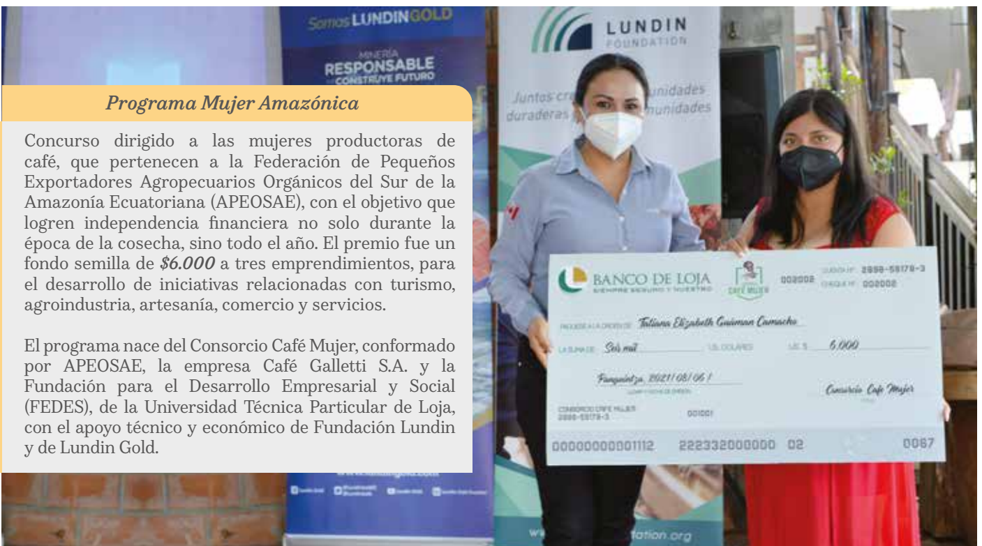
Programa Mujer Amazónica

Se ejecutó través de la Escuela de Negocios de la Cámara de Comercio de Quito junto con la embajada de Estados Unidos en Ecuador. Es un proceso de capacitación enfocado en los componentes básicos del negocio, dirigido a mujeres que desean iniciar o mejorar su propia pequeña empresa. Lundin Gold financió su implementación en Zamora Chinchipe y logró la participación de 30 mujeres de la zona. El primer grupo finalizó en octubre y dado el éxito de esta iniciativa, la Compañía espera continuar con más programas de este tipo a futuro.