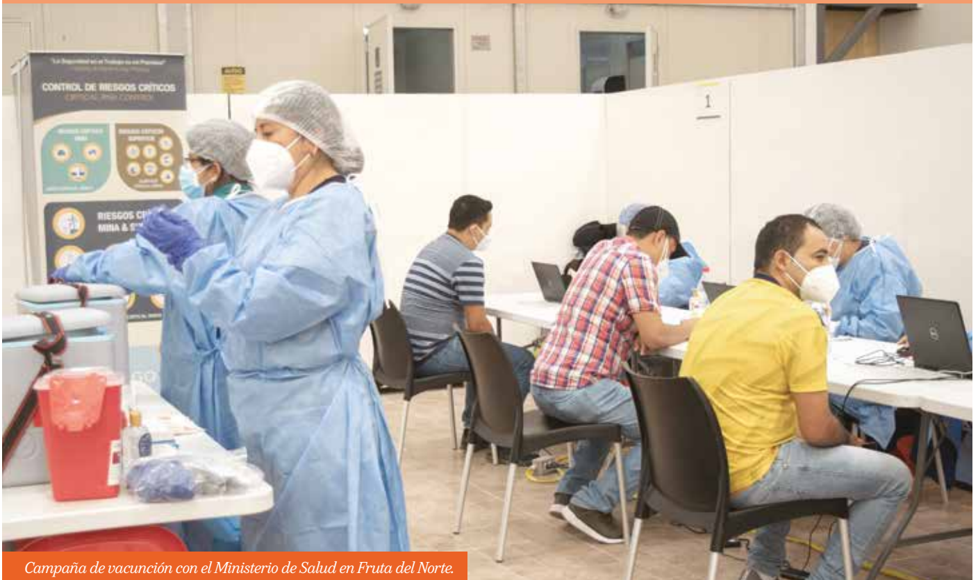
Campaña de vacunación con el Ministerio de Salud en Fruta del Norte.

Gracias a la vacunación, el periodo de cuarentena hotelera se ha reducido a 2 días, tiempo durante el cual se realiza una prueba PCR. Solo si el resultado es negativo, se autoriza el ingreso a campamento. Es importante notar que en Lundin Gold se mantiene el uso permanente de mascarilla, el lavado frecuente de manos e higiene personal, desinfección de espacios, distanciamiento físico, comunicación oportuna de síntomas, control de temperatura y exámenes periódicos para verificar el estado de salud de empleados y contratistas.