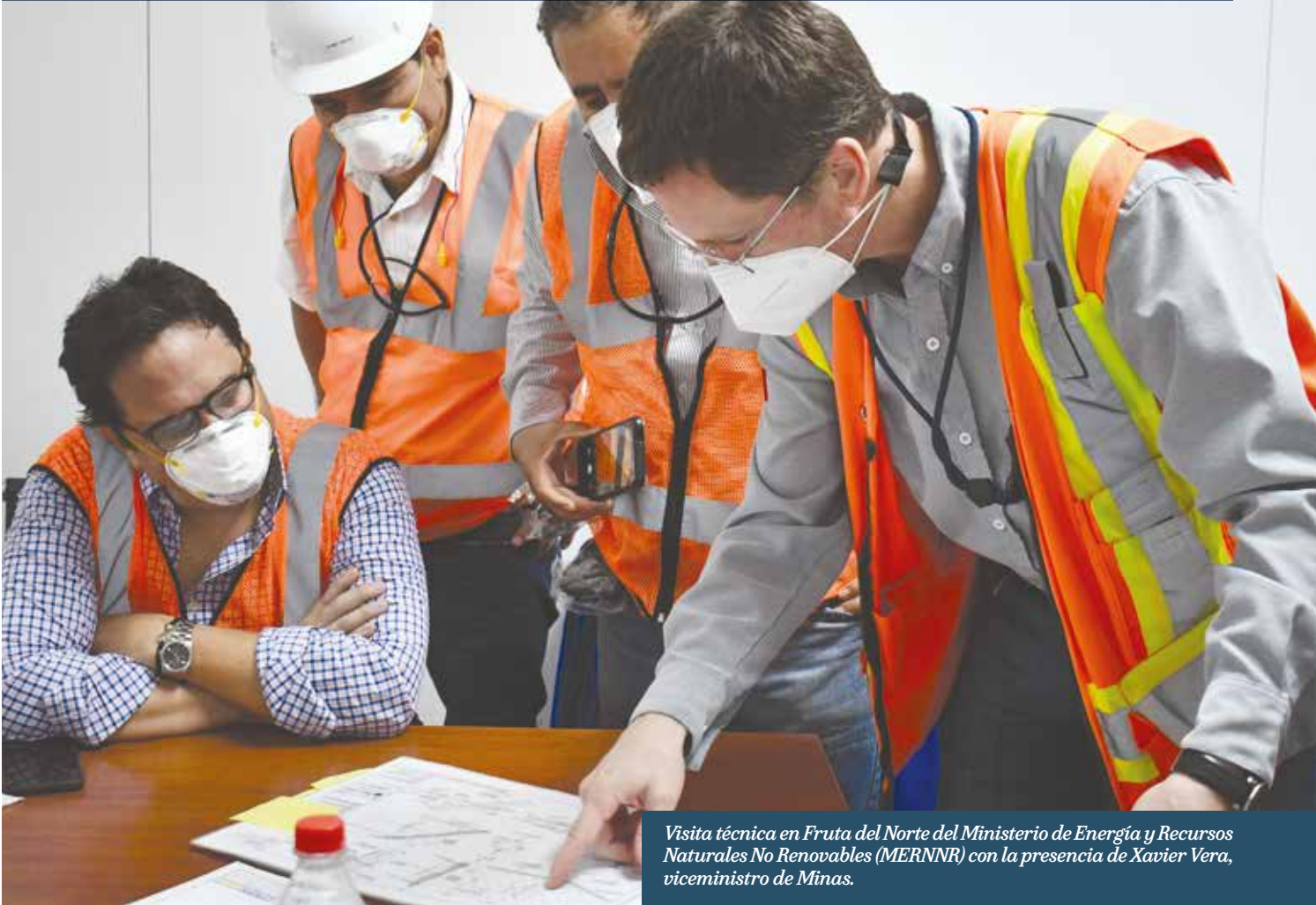
Visita técnica en Fruta del Norte del Ministerio de Energía y Recursos Naturales No Renovables (MERNNR) con la presencia de Xavier Vera, viceministro de Minas.

Las operaciones de Fruta del Norte (FDN) están bajo la supervisión permanente de las entidades de seguimiento y control nacionales, provinciales y locales.