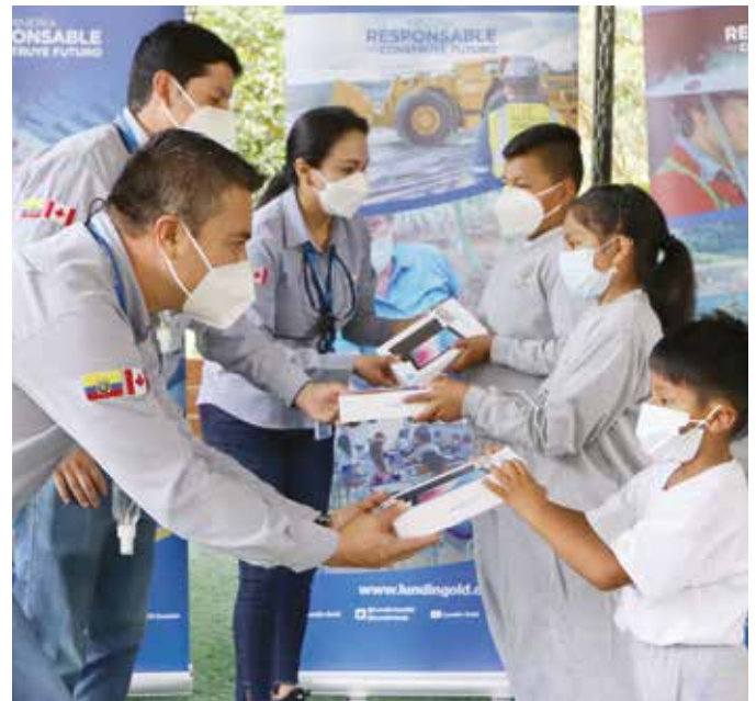
Entrega de tablets a estudiantes de los cuatro centros educativos de la zona de influencia de Fruta del Norte.

En este proyecto han participado varios contribuyentes: Fundación Lundin, Bank of Nova Scotia, Blake, Cassels & Graydon LLP, BMO Capital Markets, Boliden AB, ING Capital LLC, Natixis y Norton Rose Fulbright.