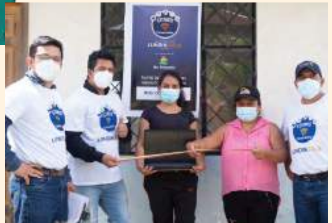
Colocación de punto WiFi gratuito en la comunidad Jardín del Cóndor.