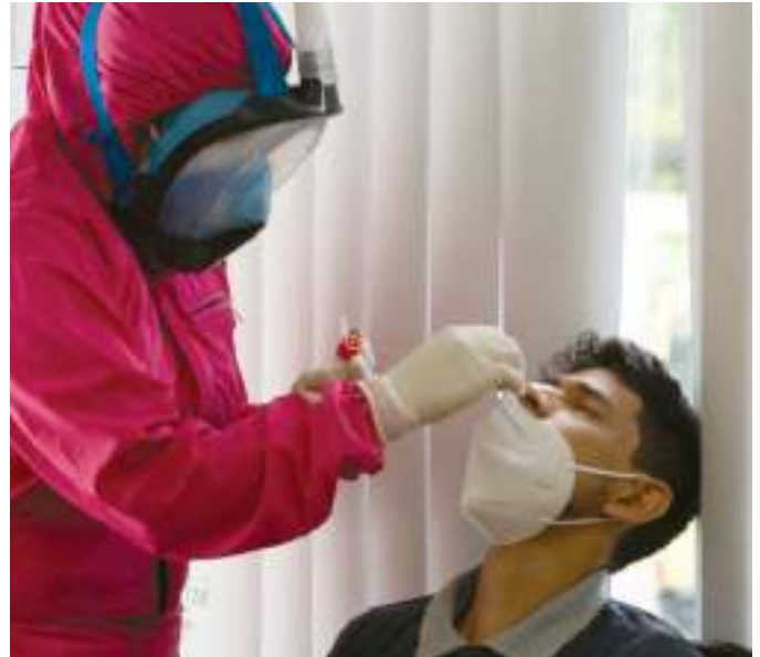
Prueba PCR en FDN 5 días posterior a la toma de la primera muestra.

En mayo del presente año, la empresa reforzó sus protocolos, por lo que, el personal que ingresa a FDN se realiza una segunda prueba PCR 5 días posterior a la toma de la primera muestra, y el uso de mascarilla KN95, distanciamiento físico, entre otras medidas, siguen siendo medidas obligatorias durante toda la jornada de trabajo.