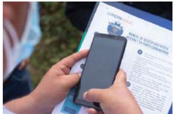
Manual de uso de los puntos de WiFi comunitarios.