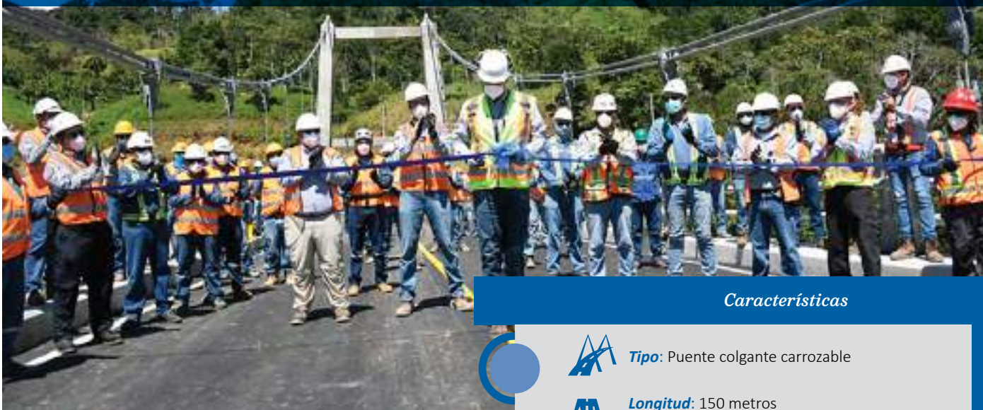
Inauguración del puente 9 de junio de 2021.

Con la finalidad de facilitar el transporte de personal, proveedores y bienes necesarios para operar la mina Fruta del Norte (FDN), y transportar sus productos a los puertos, la Compañía construyó un puente nuevo sobre el río Zamora, cerca de las comunidades El Padmi y el Pindal, en la parroquia Los Encuentros.