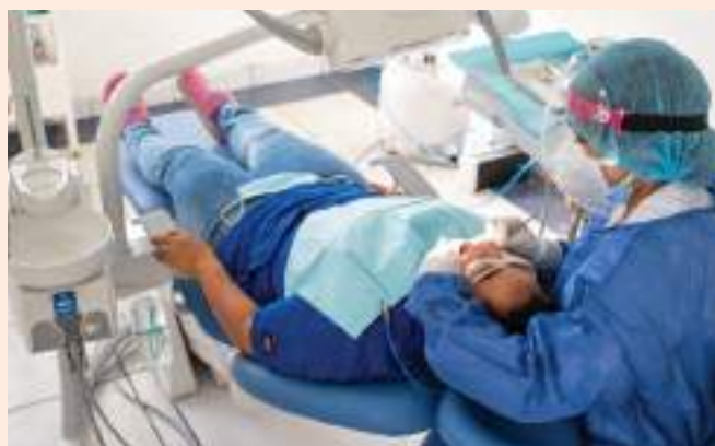
Atención odontológica gratuita mediante equipos donados por Lundin Gold.

Dotación de más de 78 mil insumos y materiales para desinfección a diferentes grupos y entidades como hospitales, centros de salud, GAD provincial y GADs parroquiales, Policía Nacional, Ministerio de Educación, Ejército, entre otros actores; financiamiento de equipos para la adecuación de una Unidad de Cuidados Intensivos para el Hospital Básico de Yantzaza y donación de equipos odontológicos al centro de salud de Los Encuentros.