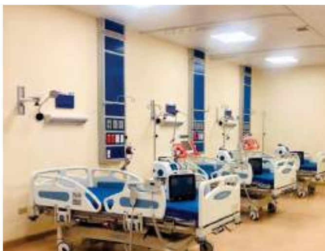
136 equipos médicos de última tecnología entregados al Hospital Básico de Yantzaza.

La UCI tiene por objeto, en el corto plazo, enfrentar los efectos de la pandemia del COVID-19, mientras que, en el largo plazo, permitirá atender otras necesidades o emergencias críticas de salud.