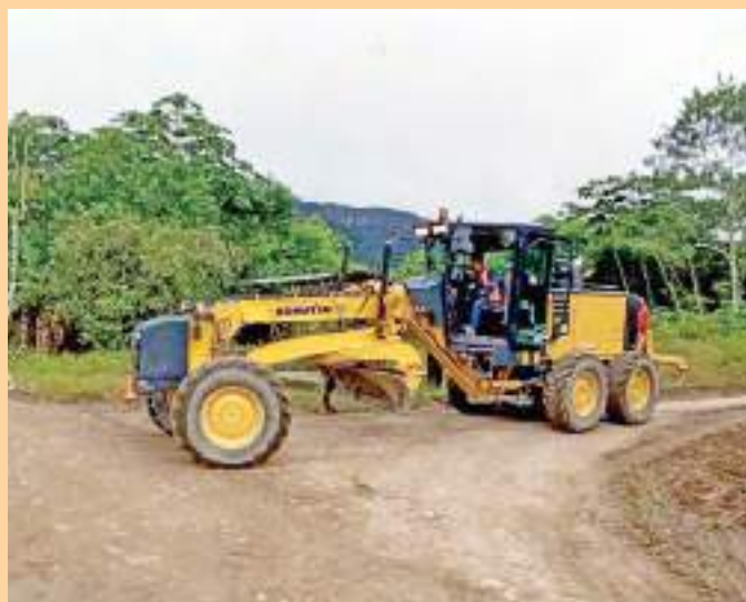
Mantenimiento en la parroquia de Los Encuentros.

Con una inversión de más de 1.3 millones de dólares, Lundin Gold, en coordinación con el Gobierno Autónomo Descentralizado de la parroquia Los Encuentros, ejecuta el proyecto de mantenimiento anual de las vías que conectan a 19 centros poblados de la parroquia Los Encuentros.