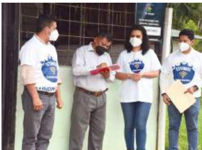
Colocación de punto Wifi gratuito en la comunidad Achunts.

Vicepresidente de Sostenibilidad de Negocios de Lundin Gold