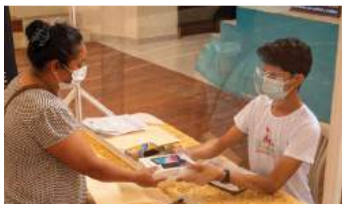
Entrega de tablets a través de los representantes de los estudiantes.