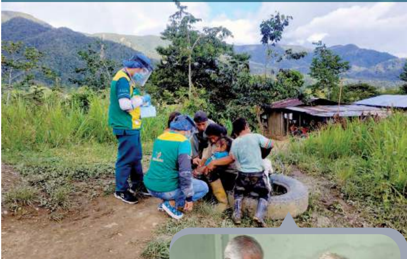
Visitas de atención médica en comunidades.

El programa gubernamental “Médico del Barrio” en la parroquia Los Encuentros, recibe el apoyo de Lundin Gold.