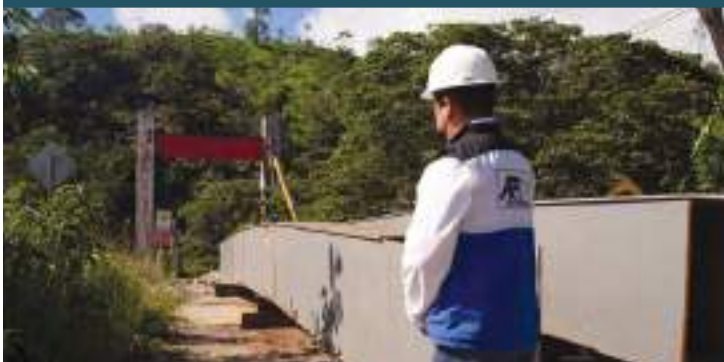
Puente sobre el río Zamora en la Cabecera Parroquial Los Encuentros.

De forma paralela, Lundin Gold financia la construcción del nuevo puente sobre el río Zamora ubicado en la cabecera parroquial de Los Encuentros, obra a cargo del GAD Provincial de Zamora Chinchipe. Una vez finalizada su construcción, las comunidades locales contarán con dos puentes permanentes de uso público.