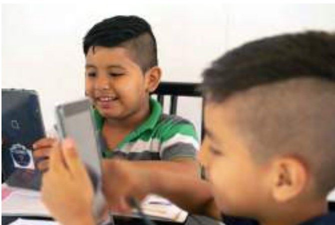
Entrega de tablets en la comunidad Muchime.