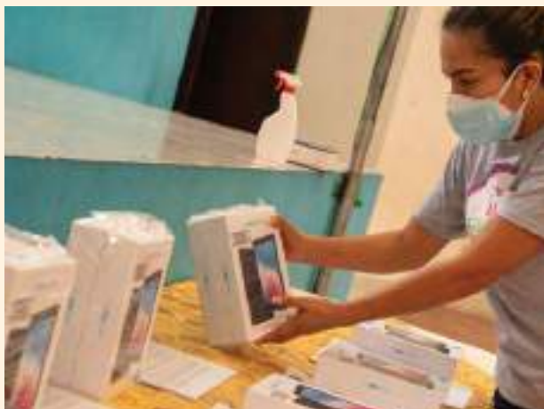
Entrega de 1370 tablets en la Unidad Educativa del Milenio “10 de Noviembre”.

Dotación de más de 78 mil insumos y materiales para desinfección a diferentes grupos y entidades como hospitales, centros de salud, GAD provincial y GADs parroquiales, Policía Nacional, Ministerio de Educación, Ejército, entre otros actores; financiamiento de equipos para la adecuación de una Unidad de Cuidados Intensivos para el Hospital Básico de Yantzaza y donación de equipos odontológicos al centro de salud de Los Encuentros.