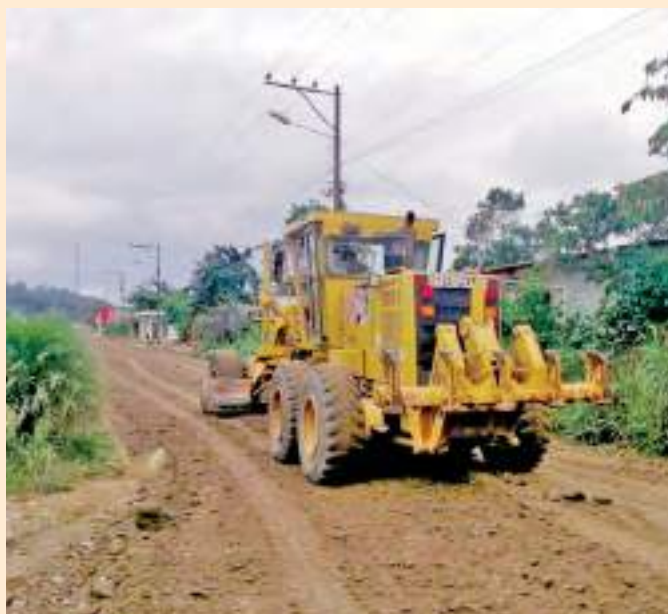
Mantenimiento vial en el cantón Paquisha.

El proyecto incluye 15 tramos viales que recibirán mantenimiento permanente durante todo el 2021; mientras que en otros 15 tramos se realizará el mantenimiento dos veces al año.