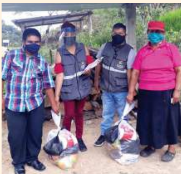
Entrega de kits alimenticios en la parroquia de Chicaña.

Entrega de productos de consumo básico para grupos vulnerables e implementación de la campaña de sensibilización contra el COVID-19 “Está en Tus Manos” junto al GAD Parroquial de Los Encuentros.