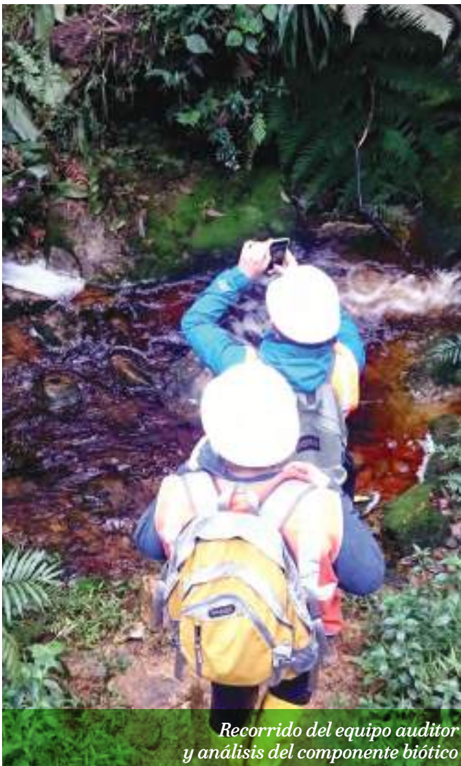
Recorrido del equipo auditor y análisis del componente biótico