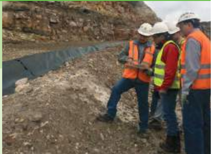
Recorrido del equipo auditor por las infraestructuras del proyecto

Según la legislación ambiental vigente en Ecuador, los proyectos mineros que cuentan con licencia ambiental son sujetos de auditorías ambientales externas. El primer proceso de auditoría de un proyecto se realiza al transcurrir el primer año a partir de la emisión de la licencia ambiental y posteriormente, cada dos años.