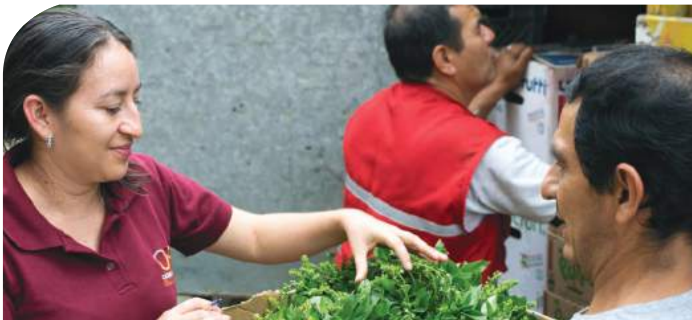
Proveedores locales entregan producto a Catering Las Peñas.