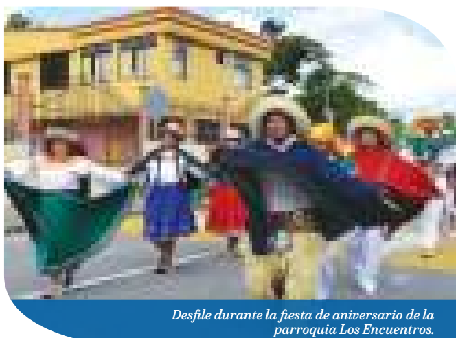
Desfile durante la fiesta de aniversario de la parroquia Los Encuentros.

El programa de fiestas cerró con competencias de motocross, cuadrones, y una noche juvenil amenizada con artistas invitados.