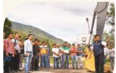
Participantes durante la inauguración de la Capacitación en Maquinaria Pesada.

El Centro de Innovación y Desarrollo Para la Industria y Minería de la UTPL conjuntamente con la Fundación Lundin, han beneficiado con esta capacitación a 21 estudiantes de la parroquia Los Encuentros, becándolos para que puedan obtener la Licencia tipo G acreditada en maquinaria pesada y equipo caminero. Más de 80 participantes de las provincias de Loja, Zamora y Azuay, accederán a nuevas oportunidades de empleo en empresas constructoras y mineras.