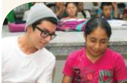
Los jóvenes de la parroquia se preparan para rendir el ENES.

Junior Achievement, con el apoyo de Lundin Gold, continúa con el programa “Ser Bachiller”. El mismo, prepara a los estudiantes de 3ero de Bachillerato para obtener su título de primer nivel y rendir los exámenes de ingreso a la universidad. Los 106 participantes reciben alrededor de 40 clases, 70% en modalidad presencial y 30%, virtual. El proceso de preparación inició en el mes octubre de 2016 con el fin de que, a mediados de este año, los jóvenes puedan rendir las evaluaciones.