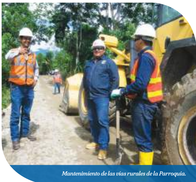
Mantenimiento de las vías rurales de la Parroquia.

Las mesas fueron creadas en 2016 con el fin de identificar y priorizar proyectos que beneficien a la comunidad. Gracias al trabajo y compromiso de los actores vinculados, se han alcanzado importantes acuerdos. Algunos de ellos descritos a continuación.