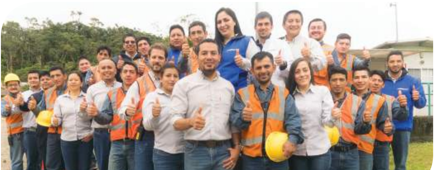
Personal de Lundin Gold en el campamento Las Peñas.

Al cierre de marzo 2017, de un total de 252 empleados, 128 (51%) pertenecen a Los Encuentros, Playón y Río Blanco; 17 (7%) personas son de las parroquias Chicaña y Yantzaza, y 11 (4%) provienen del resto de la provincia de Zamora Chinchipe. Es decir, el 62% de la mano de obra actual de Lundin Gold, pertenece a Zamora Chinchipe. El porcentaje restante está conformado, en su gran mayoría, por personal ecuatoriano.