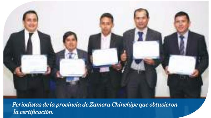
Periodistas de la provincia de Zamora Chinchipe que obtuvieron la certificación.

La Certificación Profesional en Reportería Minera es una de las varias iniciativas que la Compañía tiene previsto realizar para formar a los profesionales de la comunicación en esta nueva industria en el Ecuador.