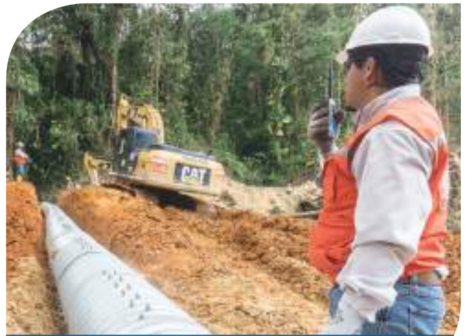
Avances en los trabajos de Obras Tempranas.

Actualmente, la Compañía desarrolla los trabajos de Obras Tempranas y para ello, el equipo ambiental trabaja junto al equipo de construcciones. Los operadores de maquinaria pesada cuentan con entrenamiento para identificar vestigios arqueológicos y conocen el procedimiento en el caso del