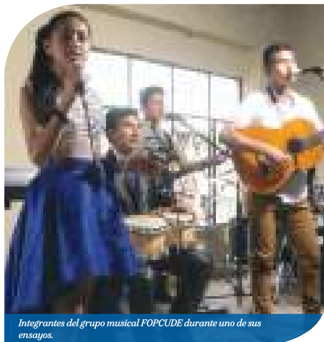
Integrantes del grupo musical FOPCUDE durante uno de sus ensayos.

La agrupación, que por segundo año consecutivo fue parte del programa de fiestas de Los Encuentros, estuvo presente este 2017 en dos actividades representativas de esta celebración con la presentación de tres mosaicos compuestos de varias canciones cada uno.