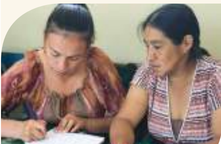
Estudiantes del programa durante su jornada de clases.

A inicios del mes de marzo culminó el Iero de Bachillerato, uno de los tres niveles que comprende este ciclo. Participaron 148 estudiantes, se registró una asistencia del 80% y un promedio general de 8.30. Los estudiantes han demostrado estar comprometidos y motivados, un ejemplo de ello, fue la participación que tuvieron en las fiestas de aniversario de la Parroquia Los Encuentros, donde exhibieron distintos emprendimientos, resultado de una de sus clases.