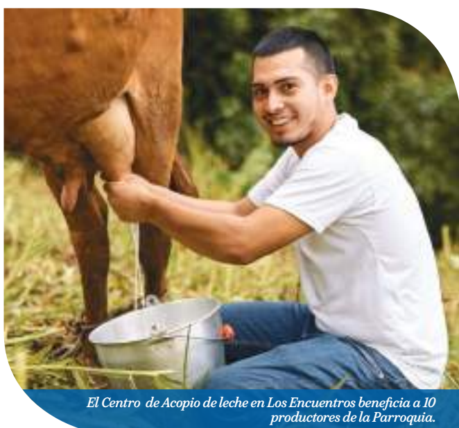
El Centro de Acopio de leche en Los Encuentros beneficia a 10 productores de la Parroquia.