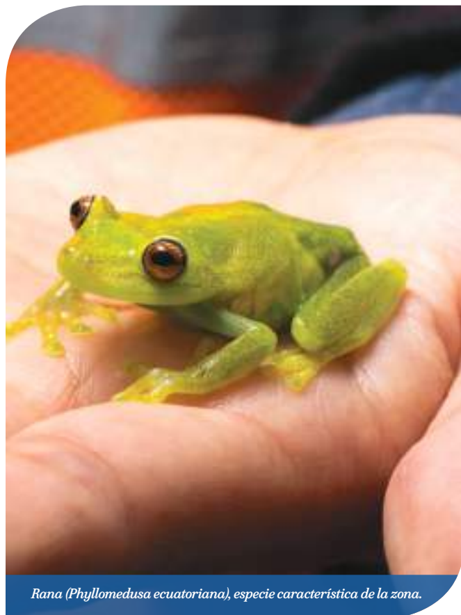
Rana ( Phyllomedusa ecuatoriana ), especie característica de la zona.

Finalmente, y dado que en un inicio el incremento del tráfico pesado causó una serie de molestias a las comunidades, el riego de la vía de acceso desde Los Encuentros hacia el campamento Las Peñas, es otra de las acciones implementadas por el Departamento de Ambiente. Fernando menciona que la Compañía “trabaja con un proveedor local de tanqueros que, previo al paso de la maquinaria, riega las vías donde existen zonas pobladas o cerca a viviendas aisladas. De esta manera se reduce la generación de polvo, minimizando el impacto en las comunidades aledañas. Lundin Gold escuchó y tomó acción sobre este problema”.