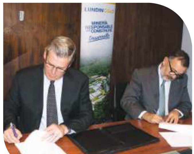
Firma del Acuerdo de Cooperación entre Lundin Gold y Conservación Internacional.

El acuerdo establece el diseño de un Programa de Conservación de la Biodiversidad en la zona del proyecto Fruta del Norte, el cual se centrará en: apoyo a la gestión de las áreas protegidas, incentivos para la conservación de los bosques, investigación y vigilancia de la biodiversidad y los recursos hídricos, producción agrícola sostenible de los bosques, educación ambiental y comunicación de los resultados.