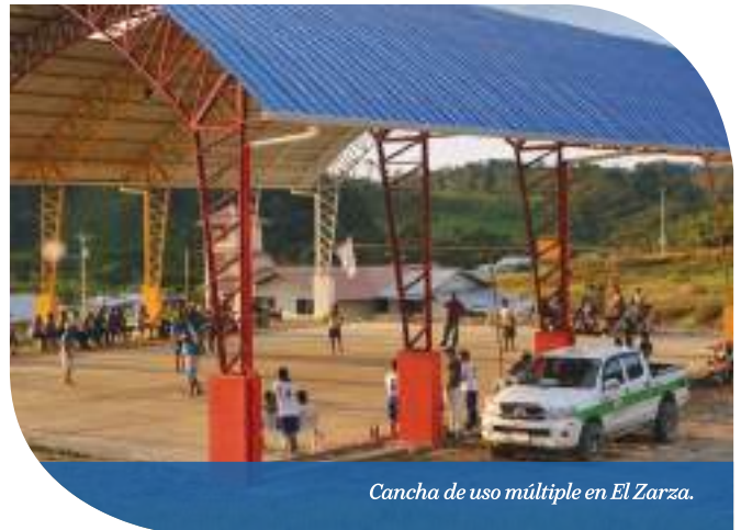
Cancha de uso múltiple en El Zarza.

Esta obra se llevó a cabo gracias a la firma del Convenio de Cooperación Interinstitucional entre el GAD de Yantzaza, El GAD Parroquial de Los Encuentros y la empresa. Las nuevas instalaciones contribuyen al sano esparcimiento, beneficiando alrededor de 120 habitantes del sector.