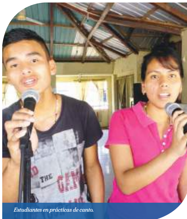
Estudiantes en prácticas de canto.

La agrupación se prepara para el lanzamiento de su producción a finales de este año. Entre sus proyectos a largo plazo, se encuentra el desarrollo de un tema dedicado a la Parroquia, en el que participen todos los estudiantes de la escuela de música.