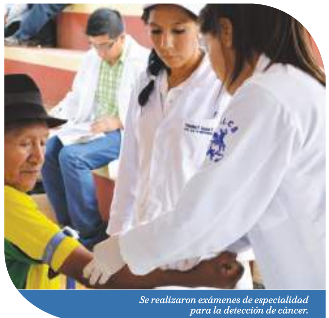
Se realizaron exámenes de especialidad para la detección de cáncer.

Un total de 125 personas entre médicos, auxiliares y voluntarios formaron parte de esta feria que contó con el apoyo de Lundin Gold tanto para su desarrollo como para el financiamiento de medicinas.