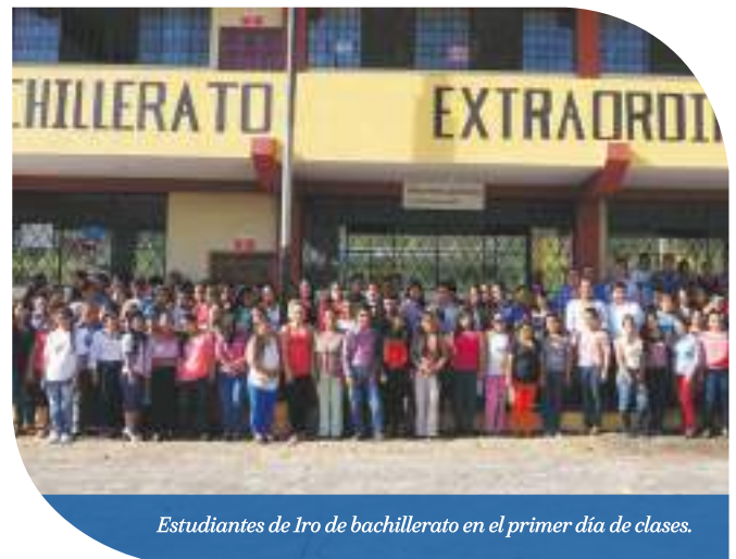
Estudiantes de 1ro de bachillerato en el primer día de clases.

El programa tiene una duración de 18 meses y contempla tres niveles: el 1ero de bachillerato, que arrancó en noviembre; y