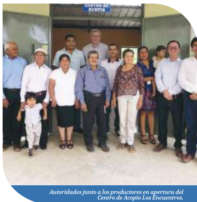
Autoridades junto a los productores en apertura del Centro de Acopio Los Encuentros.

La cadena de producción de Ecolac beneficia a alrededor de 150 ganaderos de la provincia de Zamora Chinchipe. Nueve de ellos son productores de la parroquia Los Encuentros y se espera que este número incremente en el mediano plazo.