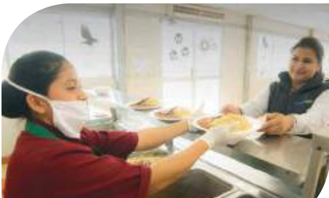
Servicio en Campamento Las Peñas, Fruta del Norte.

C atering Las Peñas nació en 2015 de la mano de cinco emprendedores de la parroquia Los Encuentros. Se propusieron formar un negocio con sello local que permitiera dar oportunidades a la gente y a los productos de la zona. Actualmente, la empresa ofrece servicios de preparación de alimentos, limpieza y lavandería para el Campamento Las Peñas.